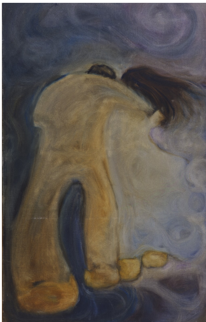
« Nous », Huile sur toile, 1980, Détails